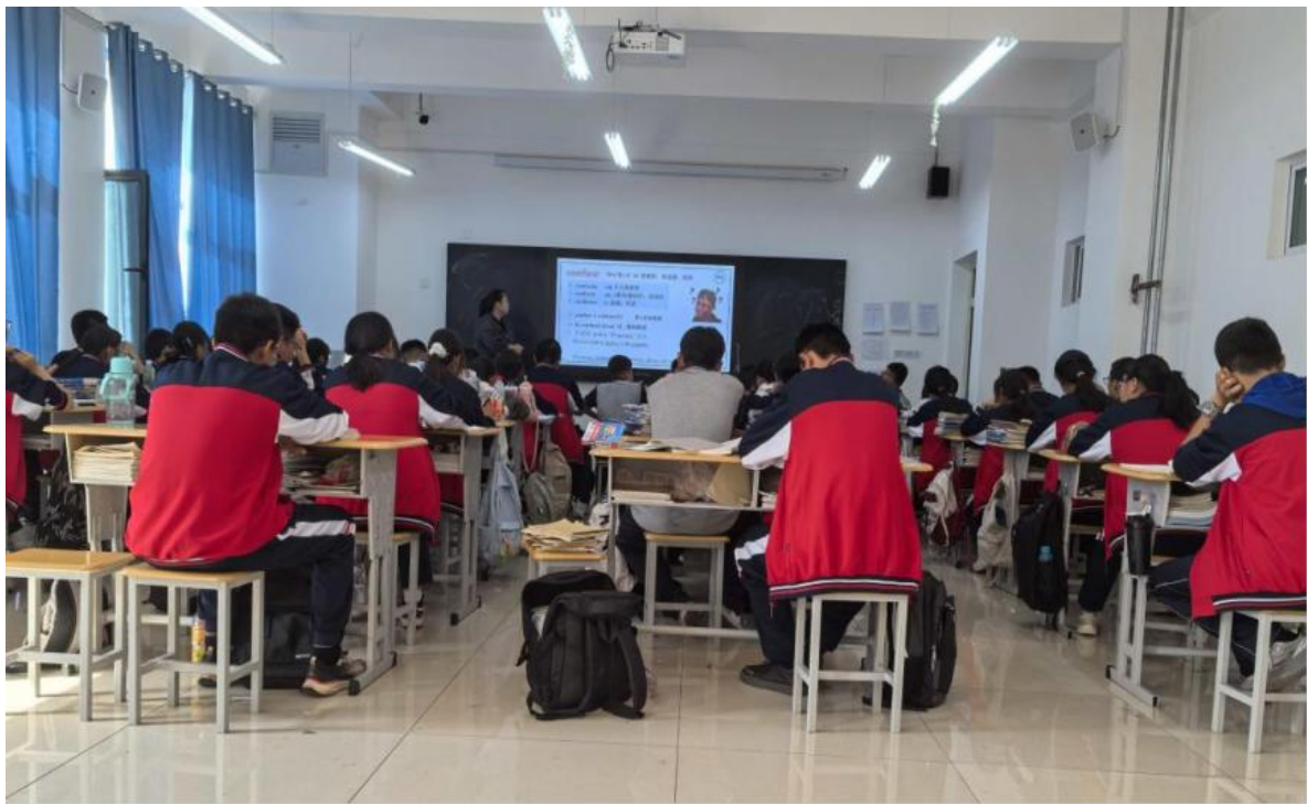
图 18 十二师职业技术学校综合高中班学生上课