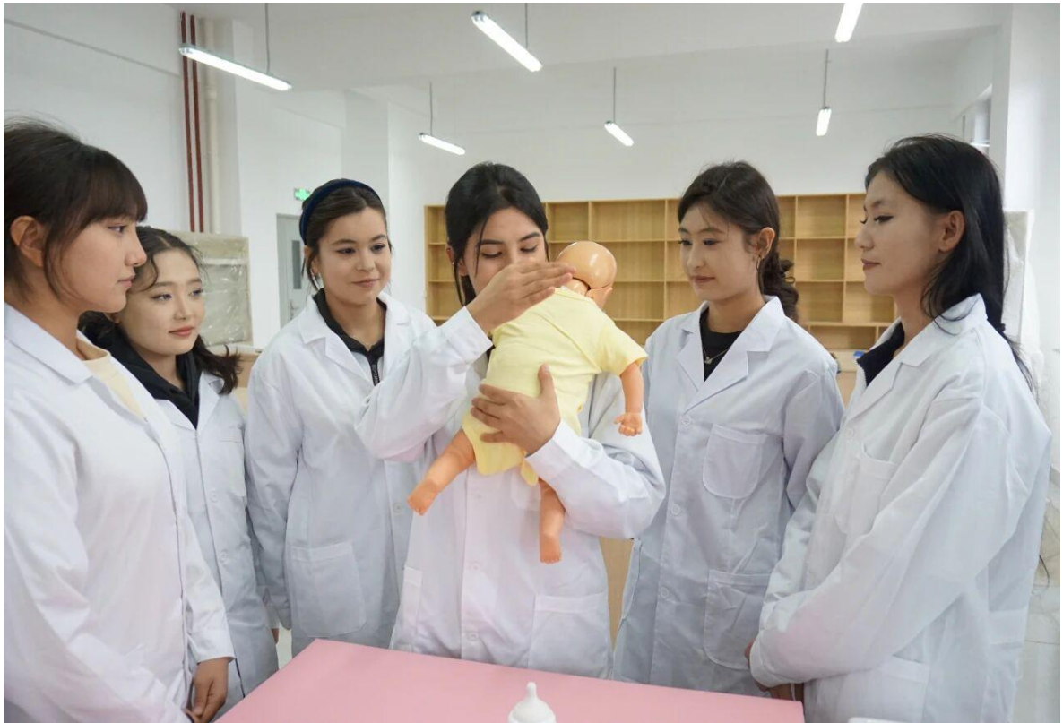
图 12 十二师开展幼儿保育职业技能培训