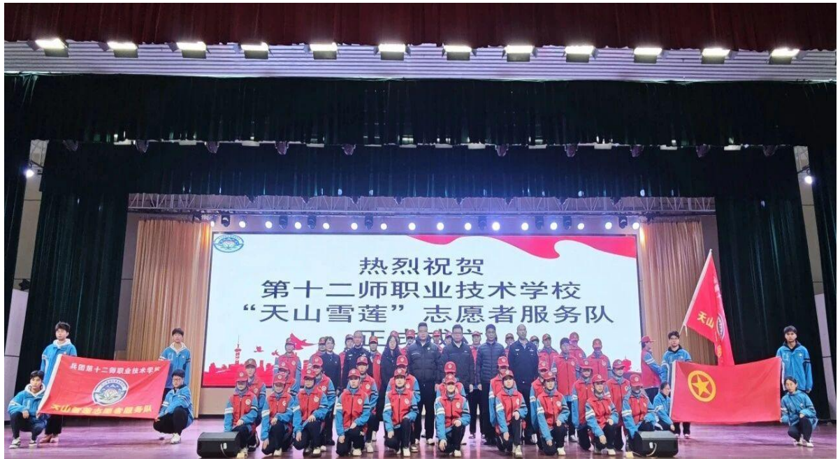
图 5 十二师职业技术学校“天山雪莲”志愿者服务队授旗仪式