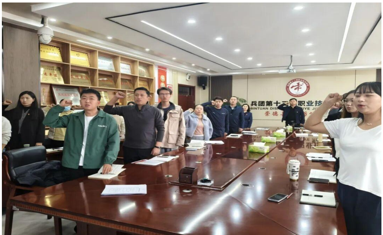
图 2 十二师职业技术学校开展主题党日活动