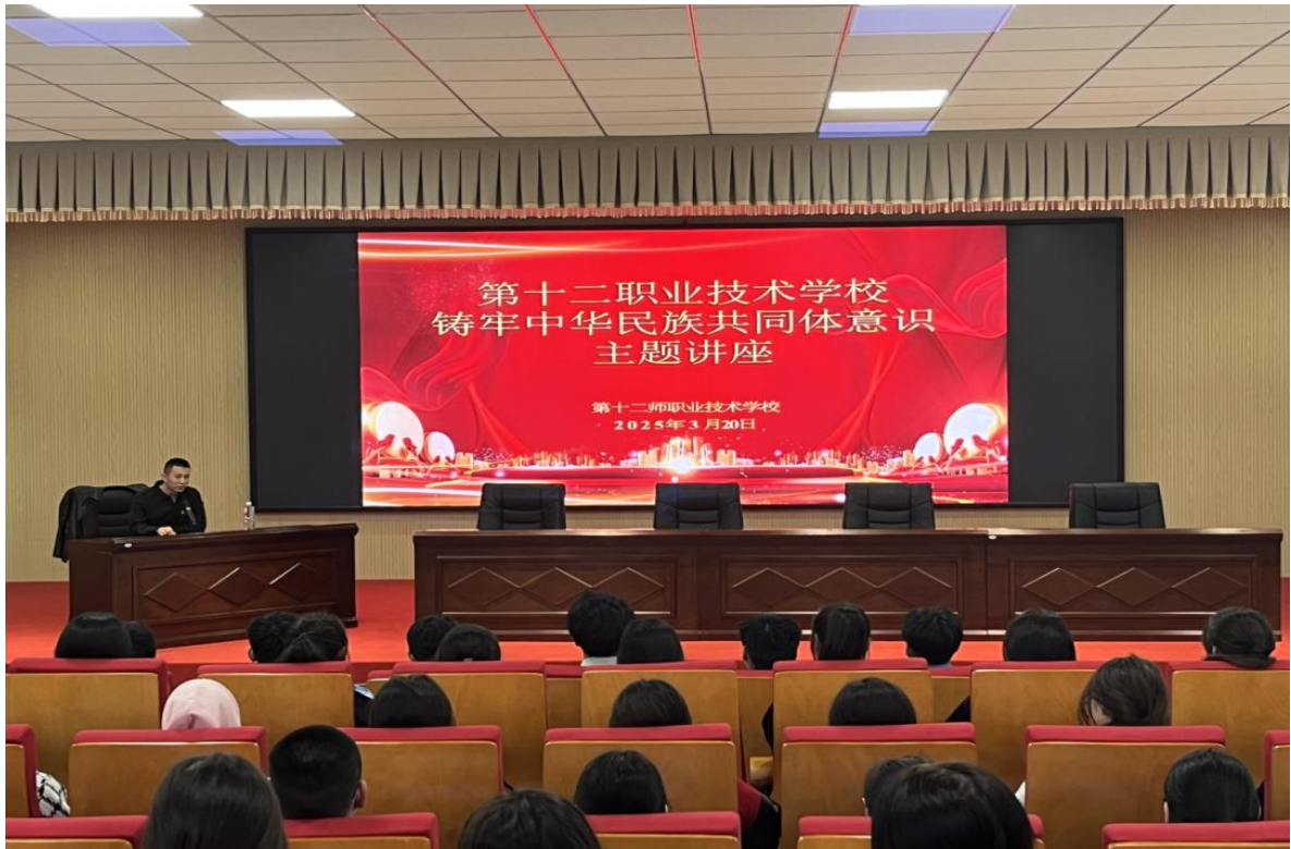
图4 十二师职业技术学校举办铸牢中华民族共同体意识专题讲座