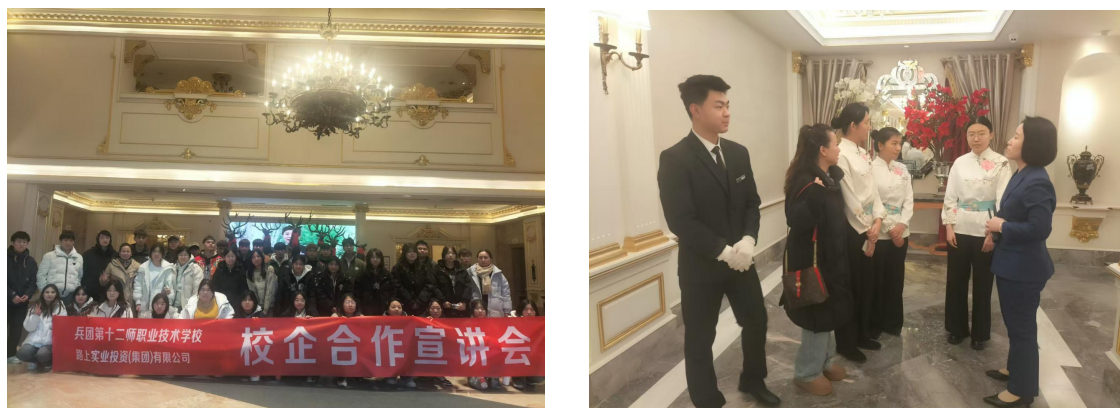
图 2 学生企业实习情况