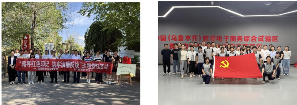
图 9 规范治校守底线 法治浸润筑平安