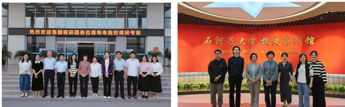
图 6 柔性引智添动力 教研创新提质效

在山东援疆团队引领下，学校教学能力大赛、师资培训、课题研究、课堂教学等工作成效显著跃升。山东省教科院开展“送教进校”活动，有效拓宽教师教学视野，提升教学实践与教研创新能力，充分彰显东西协作对口支援的实效价值。