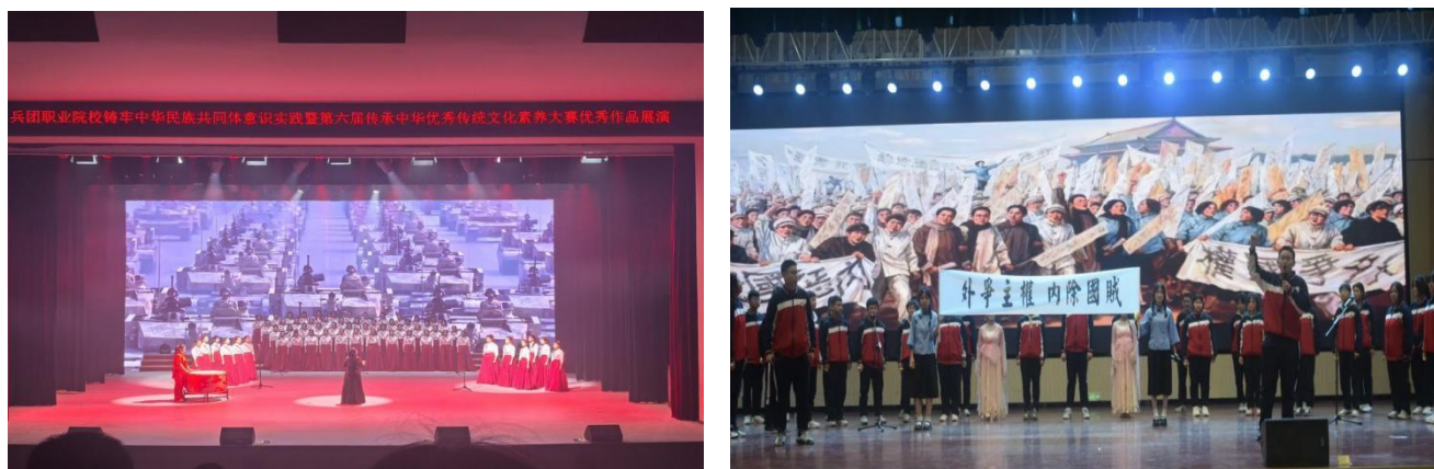
图 8 赓续红色血脉 唱响青春强音