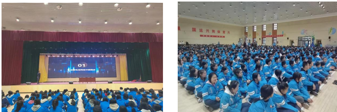
图 11 规范治校守底线 法治浸润筑平安