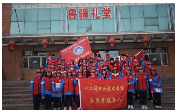
图 7 志愿服务活动