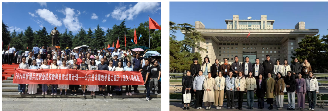
图 10 国培赋能 聚力成长