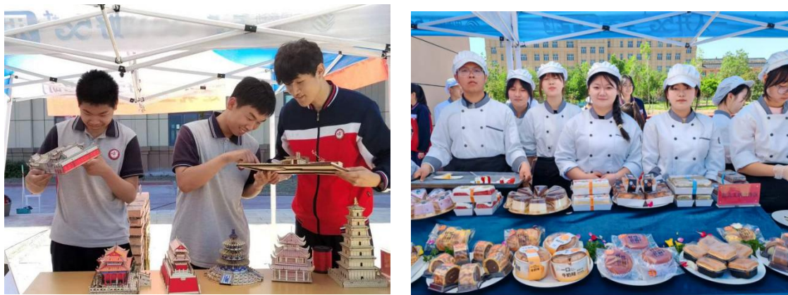
图 3 赋能以技 风采以彰