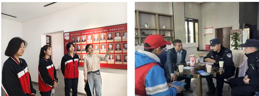
图 1 党建引领 红色研学

学校打破传统课堂壁垒，整合多方资源实现思政教育与职业素养、志愿服务、文化传承深度融合。全年累计开展志愿活动 10 余场次，覆盖群众百余人次，志愿者出动千余人次，有效提升学生爱国情怀与责任担当，为中职院校“大思政课”建设提供了可复制、可推广的实践范式。