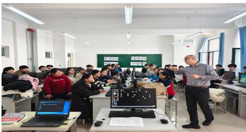
图 4 职业技能等级培训现场课堂

培训成效显著，98%参训学生通过中级技能鉴定，推动了专业群课程优化与校企资源整合，构建可复制的“培训—教学—就业”联动机制，实现学生成长与专业群建设双向赋能。