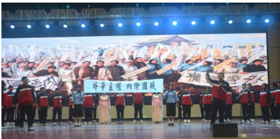
图3 十二师职业技术学校举办纪念“一二·九”运动红歌比赛

业技术学校以“赓续红色血脉·唱响青春强音”为主题举办红歌比赛，41个班级、12个专业学子参赛。比赛现场氛围热烈，学子们精神抖擞演绎《国家》《没有共产党就没有新中国》等经典红歌，更将专业所长融入表演创意，尽显团结拼搏的精神风貌。角逐后，评委团综合多维度评分评选出各等级奖项并颁奖，活动在全场齐唱《七子之歌》中落幕。此次活动以红歌为媒，既是艺术比拼，更是深刻的爱国主义教育，践行职业教育“育人为本、德技并修”理念，助力红色血脉赓续、爱国情怀扎根。