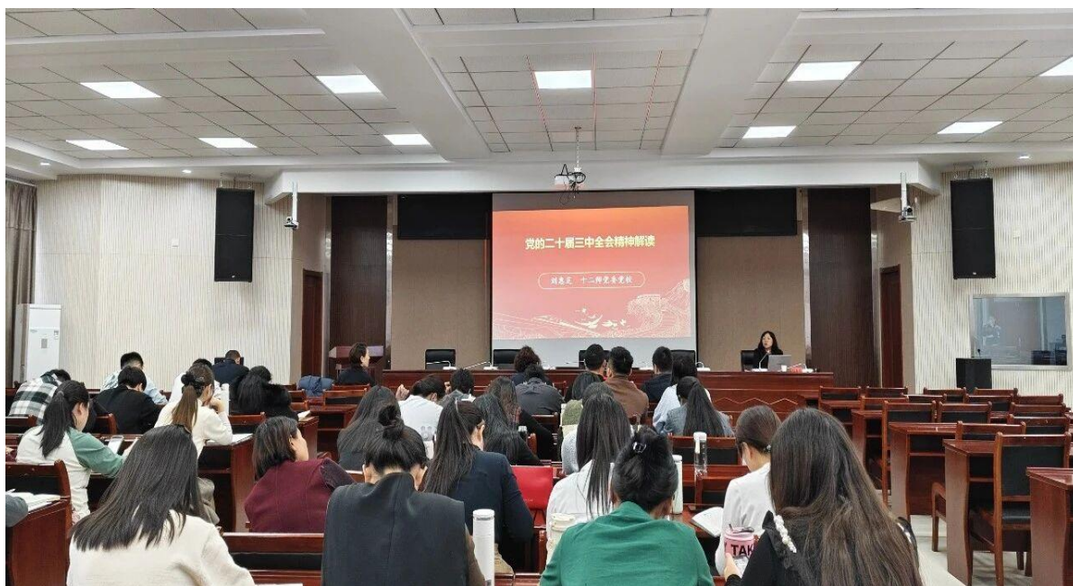
图 10 十二师职业技术学校开展师德师风专题培训