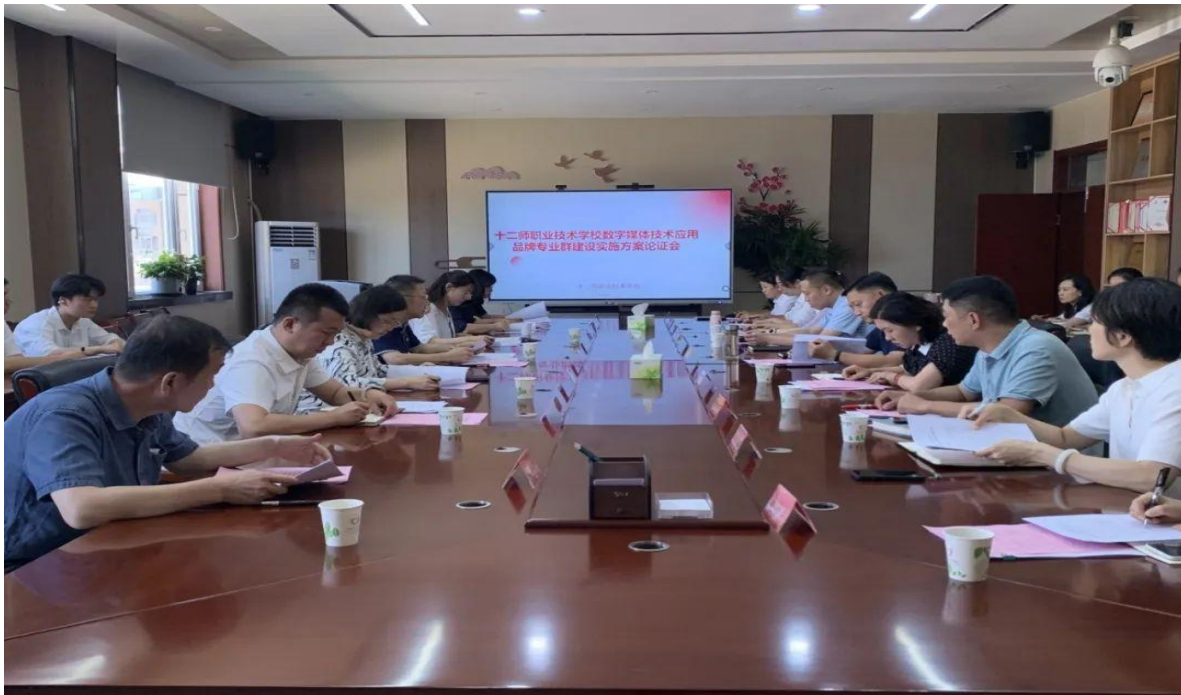
图8 十二师职业技术学校召开数字媒体技术应用品牌专业群建设实施方案论证会

为深化数字媒体技术应用品牌专业群建设，提升育人质量，十二师职业技术学校组织开展专业建设实施方案论证工作，特邀多所高校专家及企业专家组成论证团队。专家团队从专业定位、课程体系等方面深入研讨，提出前瞻性建议；企业专家建议强化与行业前沿对接，并有意愿通过“项目进课堂”等深化合作，衔接人才培养与企业需求。此次论证会搭建专业交流平台，为专业群建设指明方向。