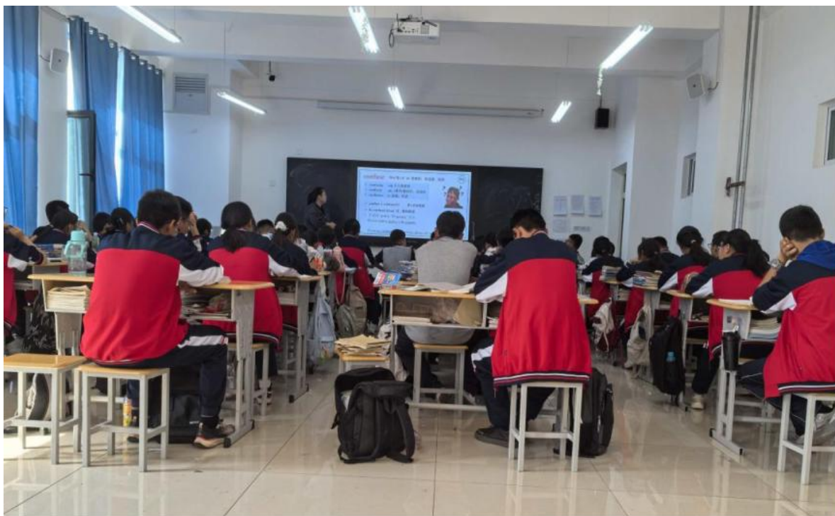
图 18 十二师职业技术学校综合高中班学生上课