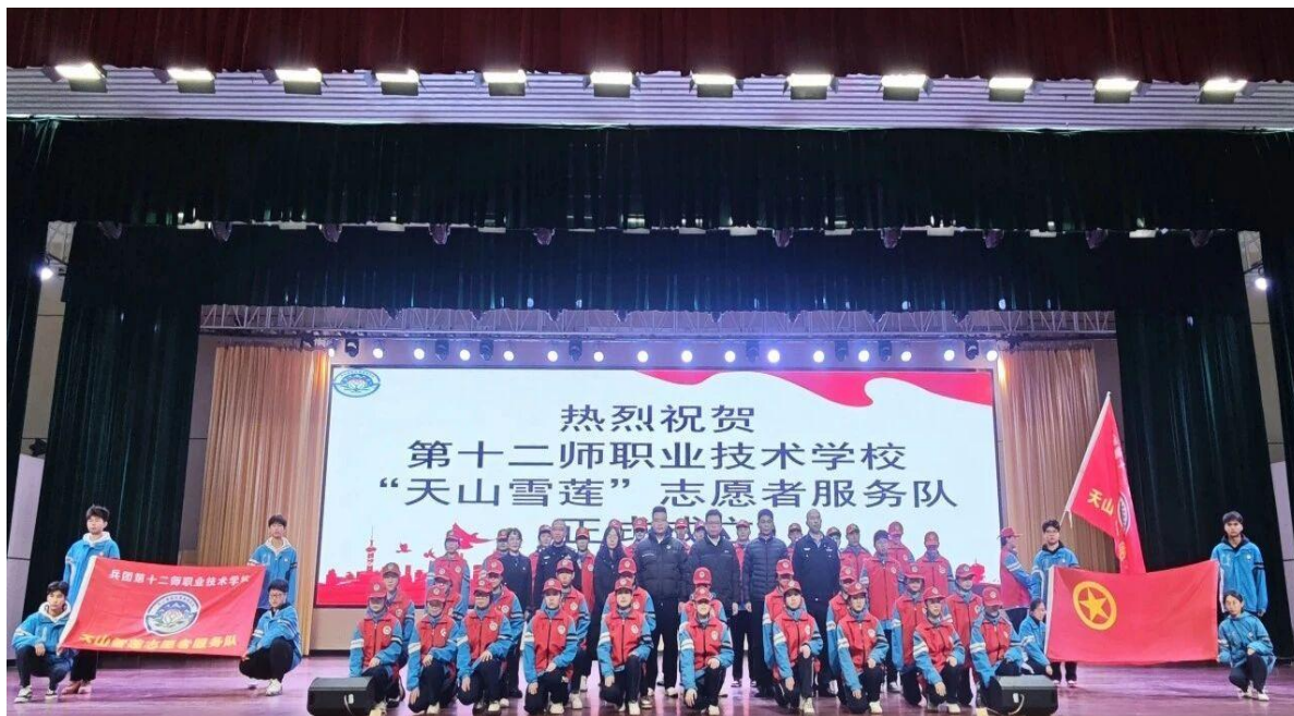
图 5 十二师职业技术学校“天山雪莲”志愿者服务队授旗仪式