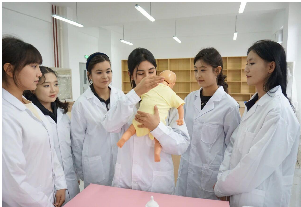
图 12 十二师开展幼儿保育职业技能培训