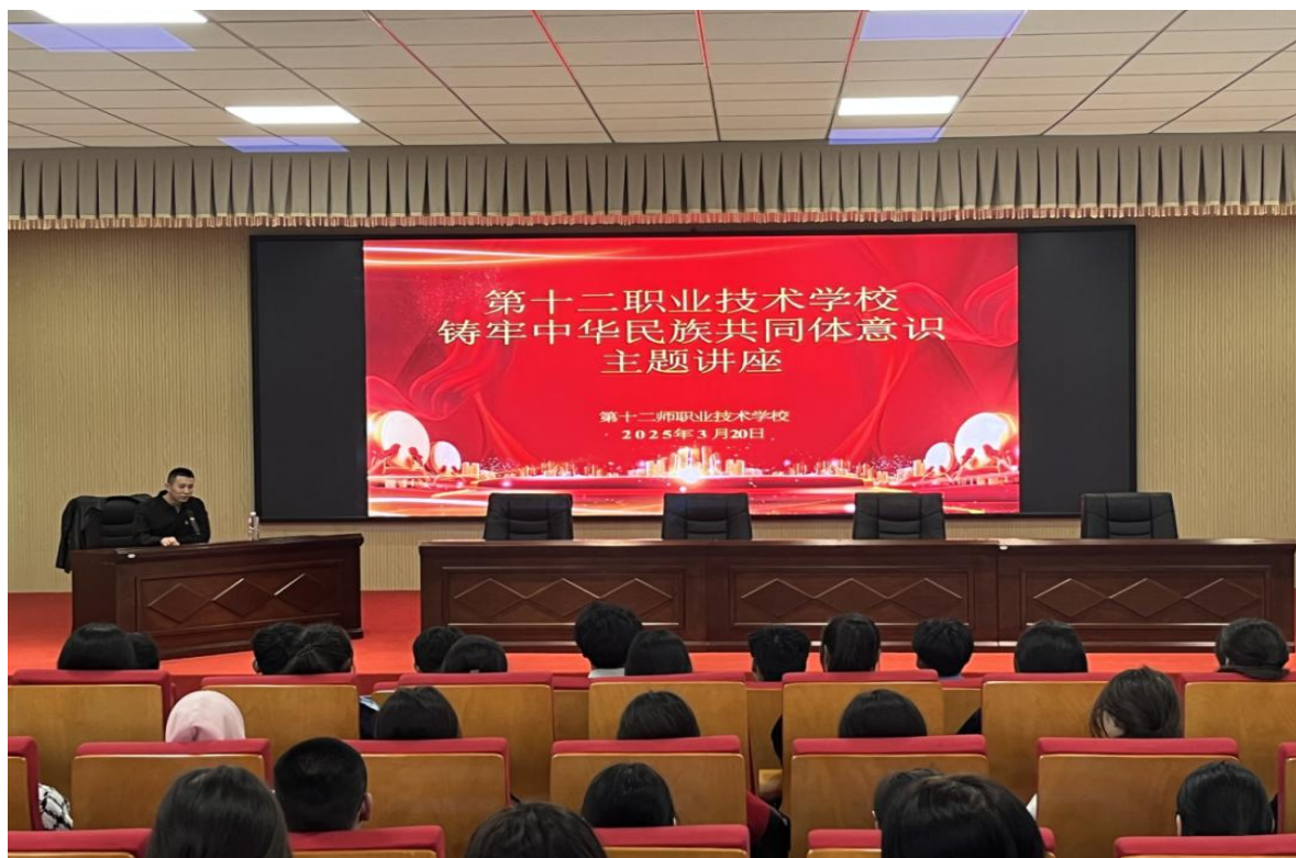
图4 十二师职业技术学校举办铸牢中华民族共同体意识专题讲座