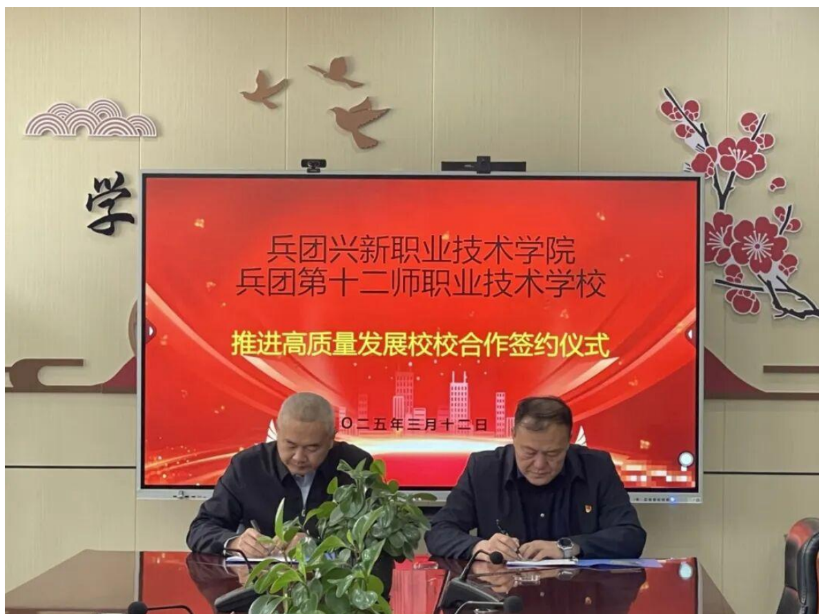
图 6 十二师职业技术学校与兵团兴新职业技术学院签订合作协议

培养等合作。双方明确将在师资交流、课程共建、实训基地共享等领域发力，打造兵团职教协同发展标杆，将为构建现代职业教育体系、赋能兵团区域经济高质量发展注入新动能。