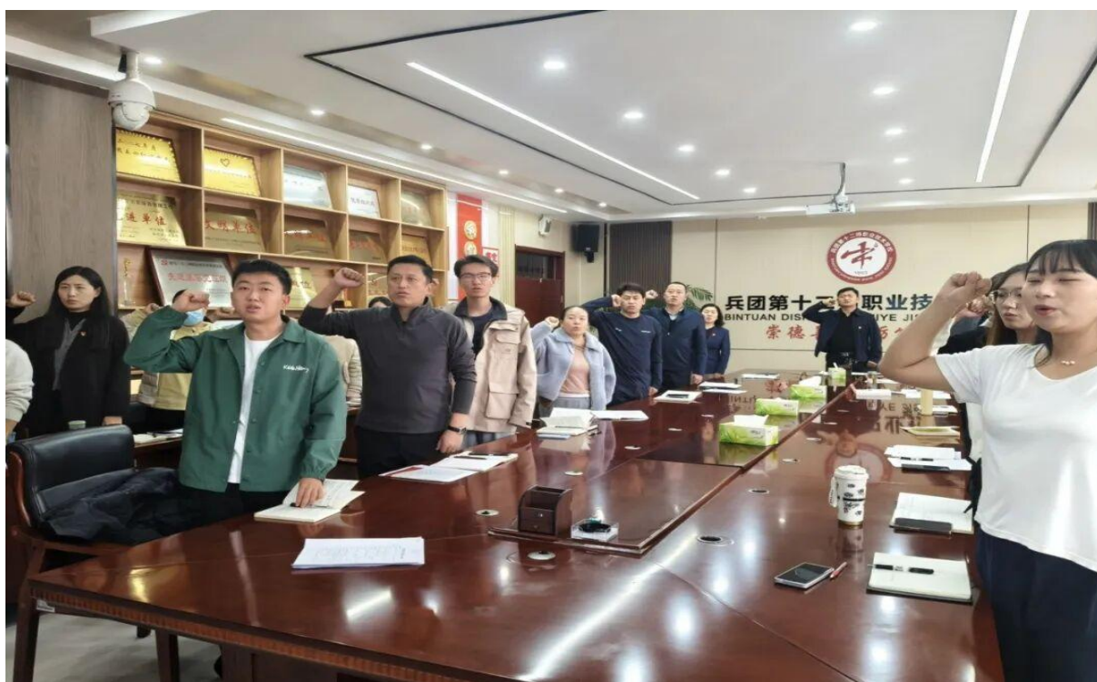
图 2 十二师职业技术学校开展主题党日活动