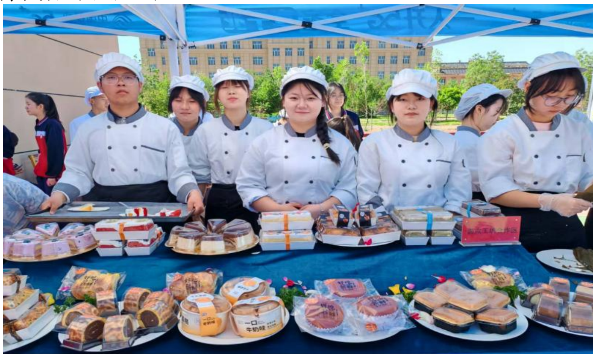
图 16 十二师职业技术学校中西式面点专业学生展现糕点制作

2025 年职业教育活动周期间，十二师职业技术学校开展中餐烹饪与中西面点专业学生技能风采秀，以“匠心传承烹四方风味，妙手巧制筑职业梦想”为核心，展现职教育人活力。活动现场，烹饪专业集中展示原料加工、果酱画、冷拼、雕刻等精湛技艺；面点专业呈现民族传统糕点、西式面点制作，传统粽子工艺将传统文化与现代技艺相融，让观众沉浸式感受职教魅力。此次展示既是专业教学水平的全面亮相，也鞭策教师精进技能。学校将持续深耕技能人才培养，助力职业教育高质量发展，培育更多高素质技术技能人才。