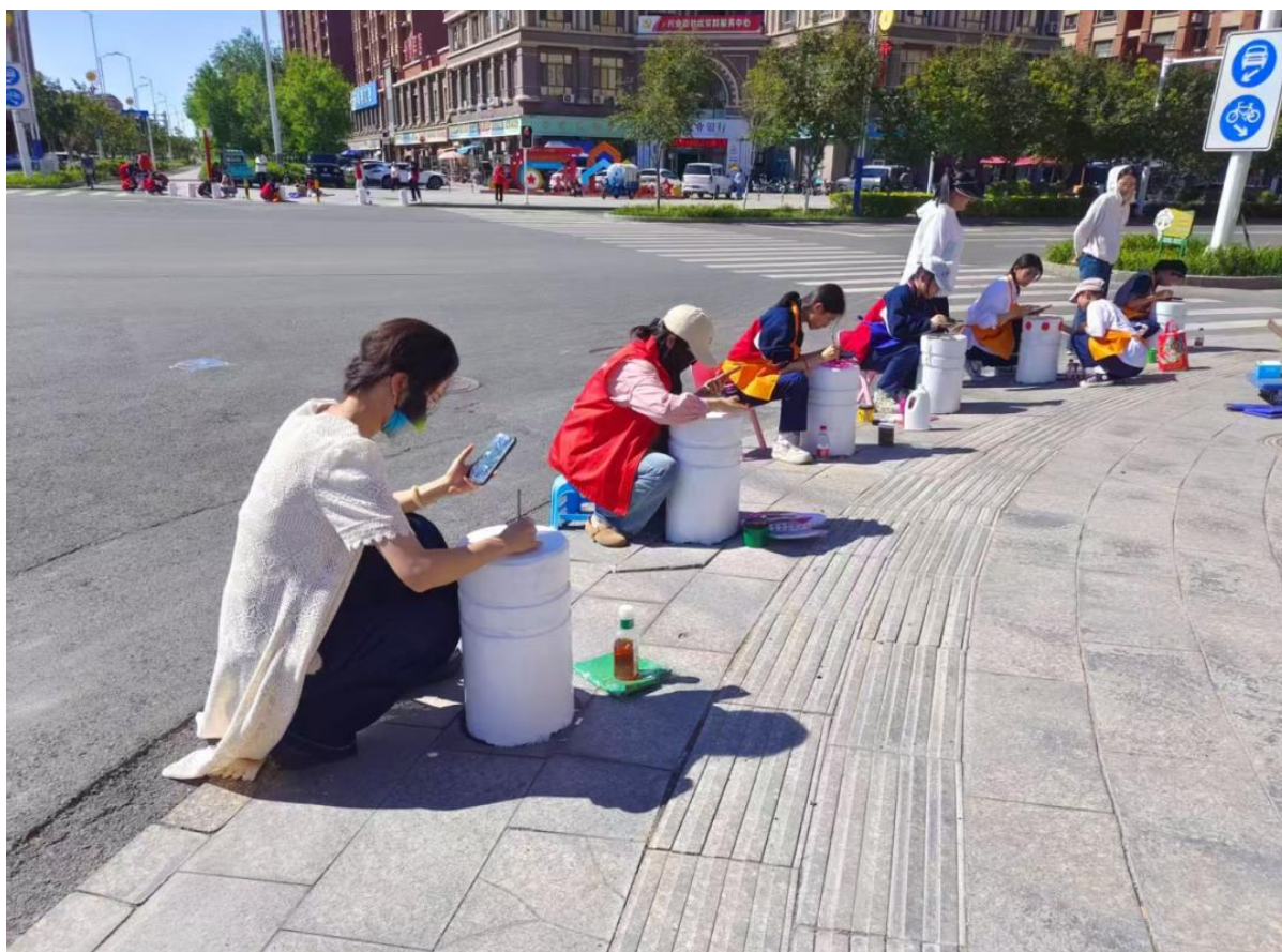
图 13 十二师职业技术学校学生开展石墩美化活动