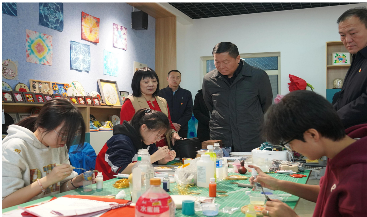
图 1 十二师党委书记、政委郝建民调研十二师职业技术学校