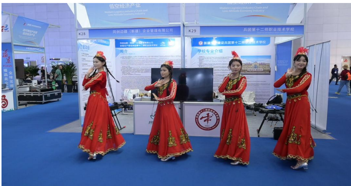
图 17 十二师职业技术学校亮相（中国）亚欧商品贸易博览会

十二师职业技术学校携手校企合作企业亮相亚欧商品贸易博览会，通过宣传手册、专业讲解等形式，全面展示招生政策、特色专业设置及校企合作成果，重点推介现代服务、信息技术等热门专业群，吸引众多参观者驻足。学校坚持以区域经济发展为导向，深化产教融合，持续推动“订单班”“工学交替”等育人模式，打通人才培养与市场需求衔接通道，助力学生“毕业即就业”，为十二师经济社会高质量发展提供人才支撑。