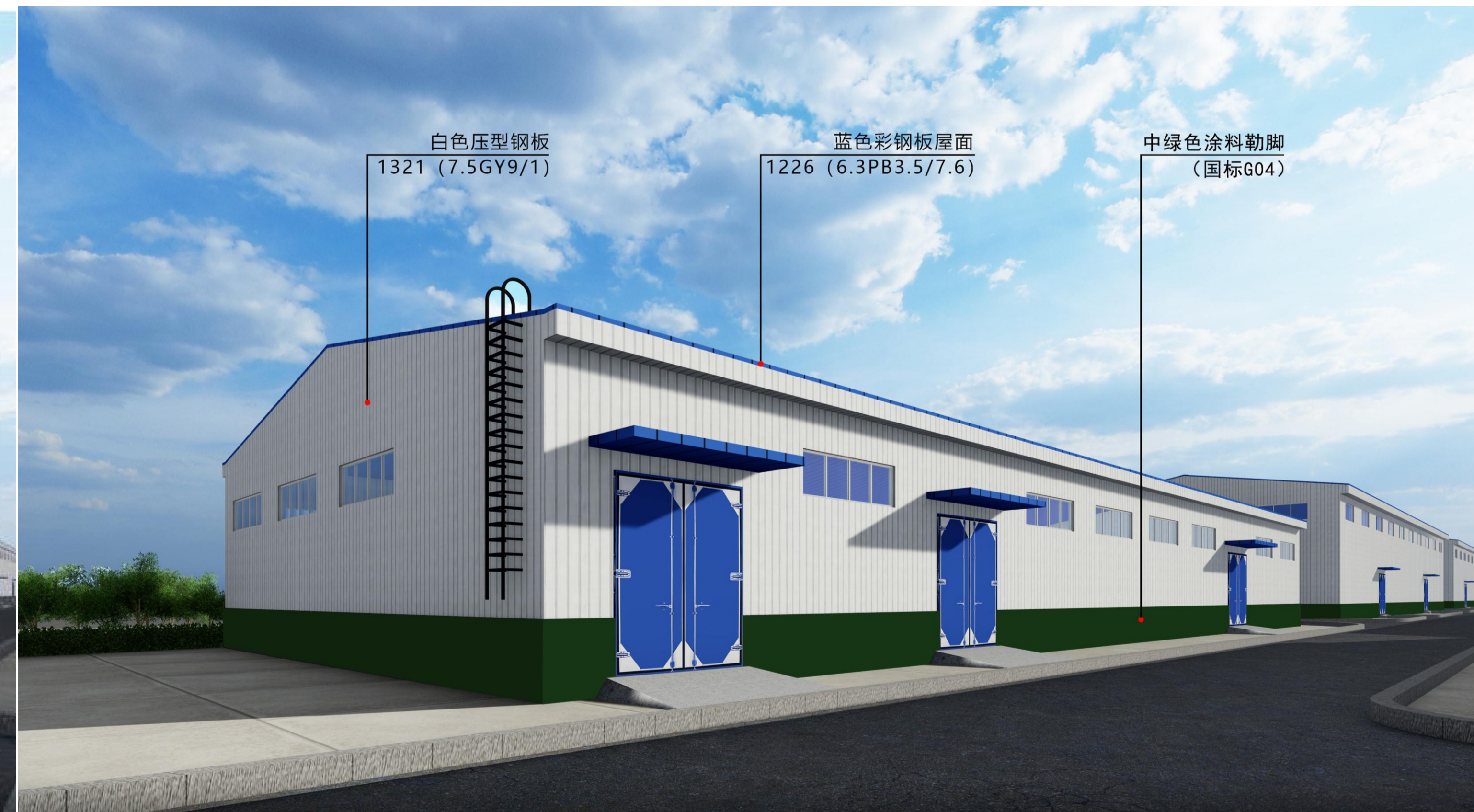
设备库调整后效果图对比