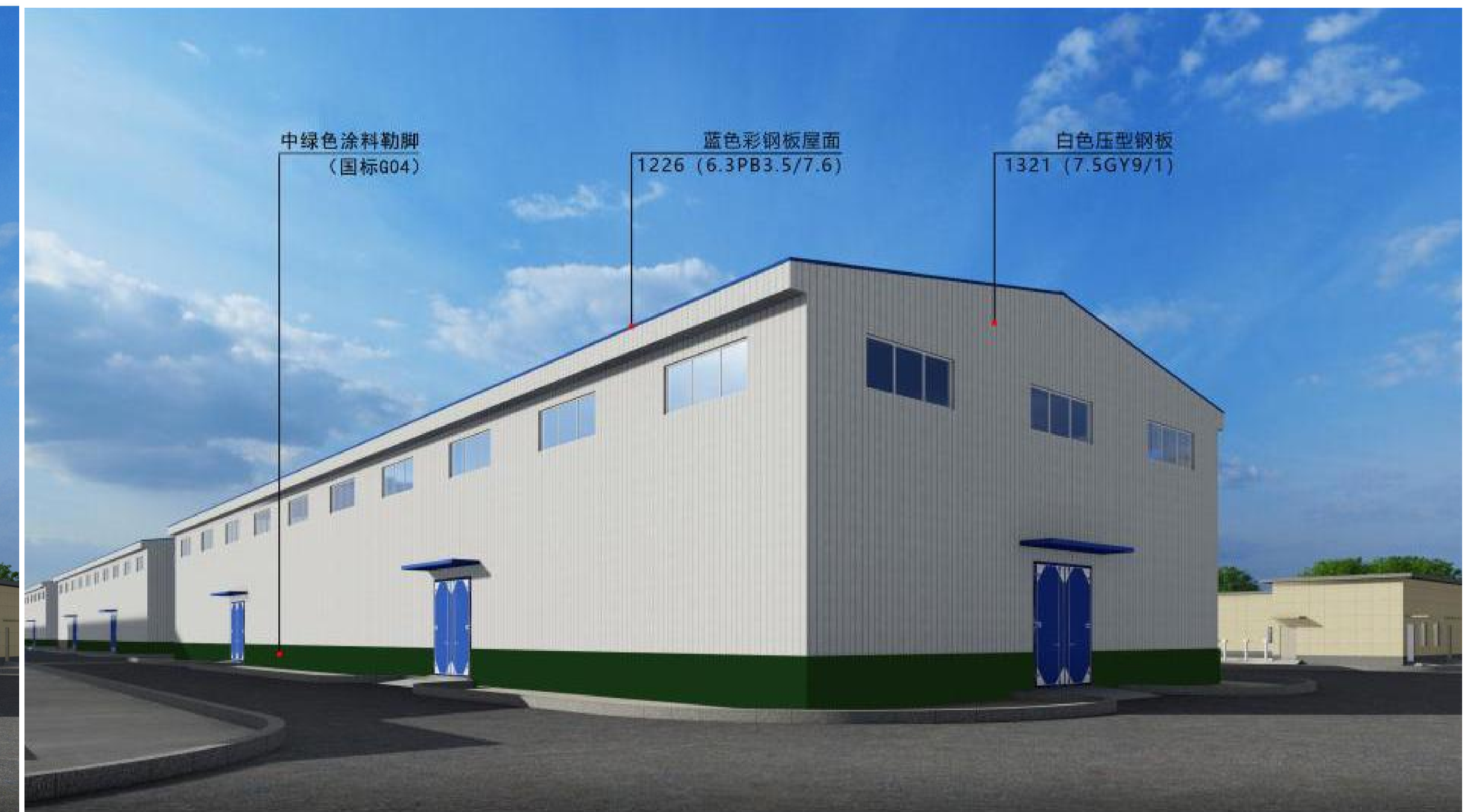
棉花库房调整后效果图对比