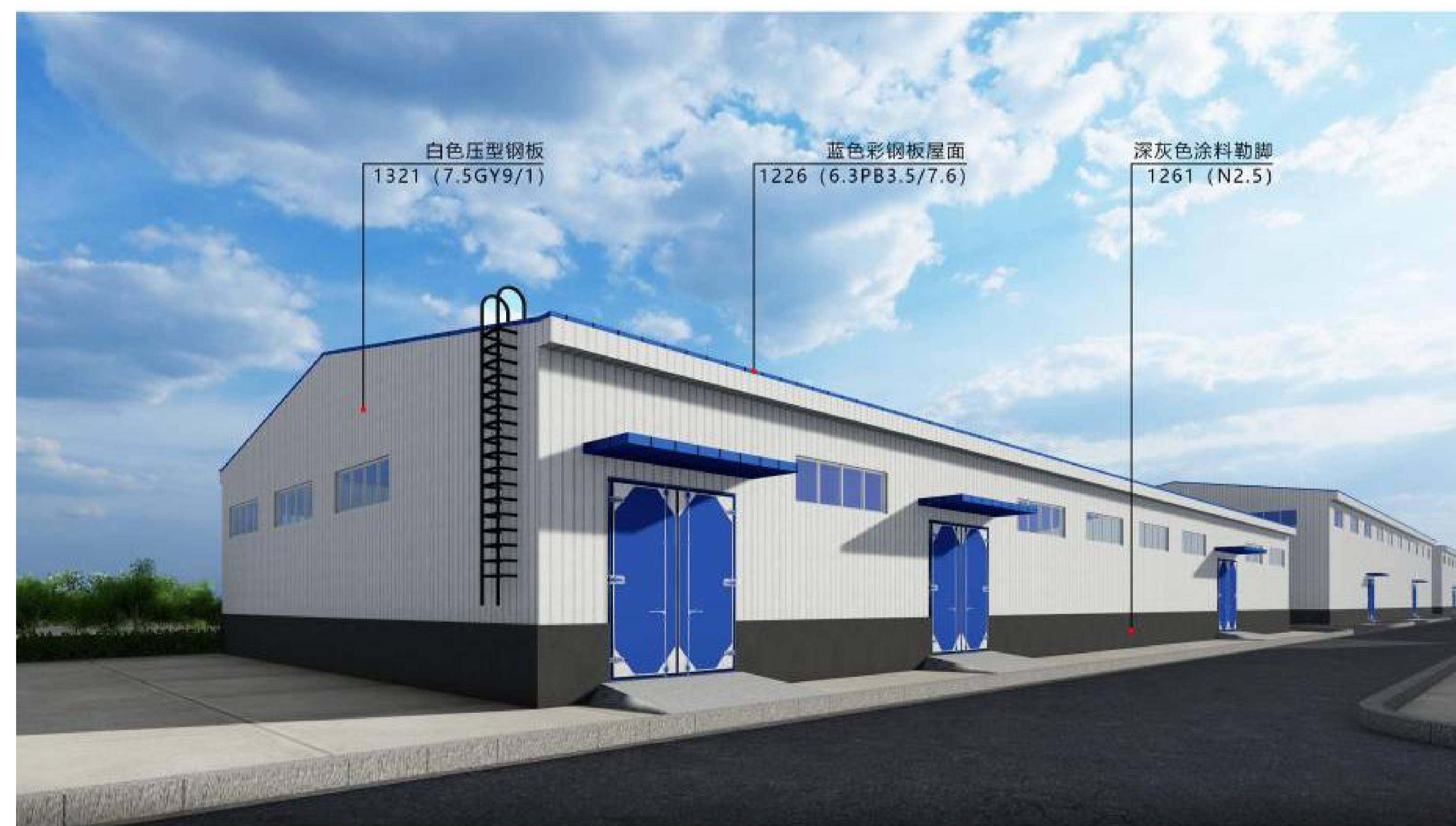
设备库调整前效果图对比